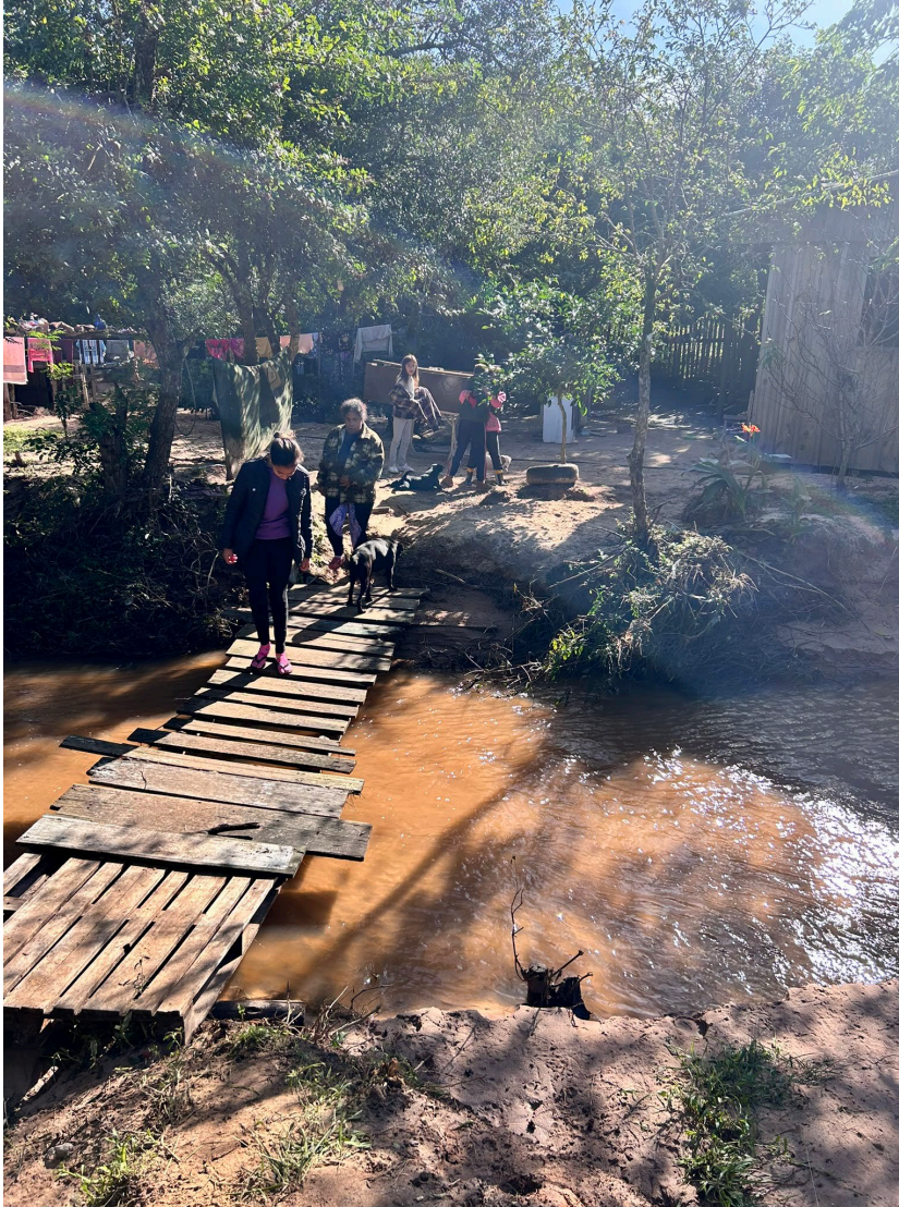
Nestas condições insalubres ele viviam