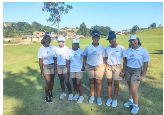
Aberto Feminino do Gávea GCC em maio de 2022: