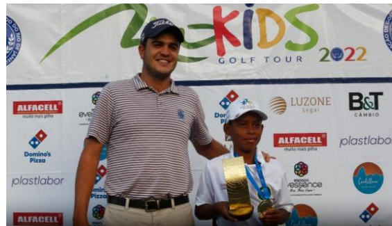
Torneio ABGF Dia das Mães, maio de 2022: